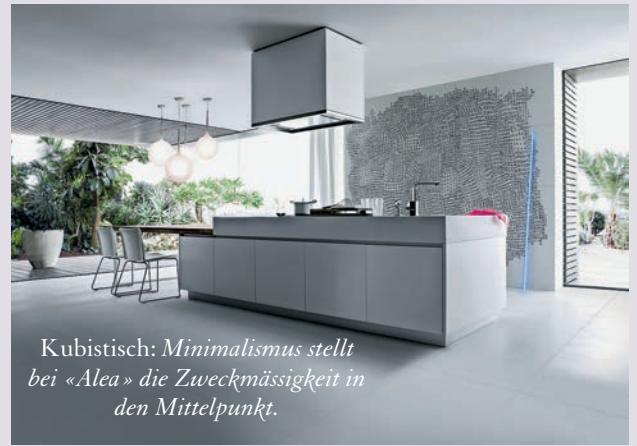
Kubistisch: Minimalismus stellt bei «Alea» die Zweckmässigkeit in den Mittelpunkt.

Fraubrunnen, Kirchstrasse 30, 3312 Fraubrunnen, T 031 760 20 20 www.fraubrunnen.com