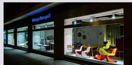
Präsentation: Auch bei Abendstimmung kann man sich Inspiration an den Schaufenstern von Rüegg-Nägeli holen.

Rüegg-Naegeli AG, Beethovenstrasse 49, 8002 Zürich T 044 204 62 62, www.ruegg-naegeli.ch