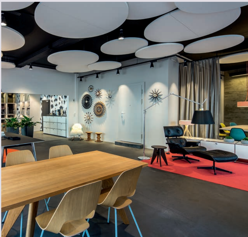
Passgenau: Eine breite Auswahl an Herstellern ermöglicht eine individuelle Ausstattung von Wohn- und Büroräumen.