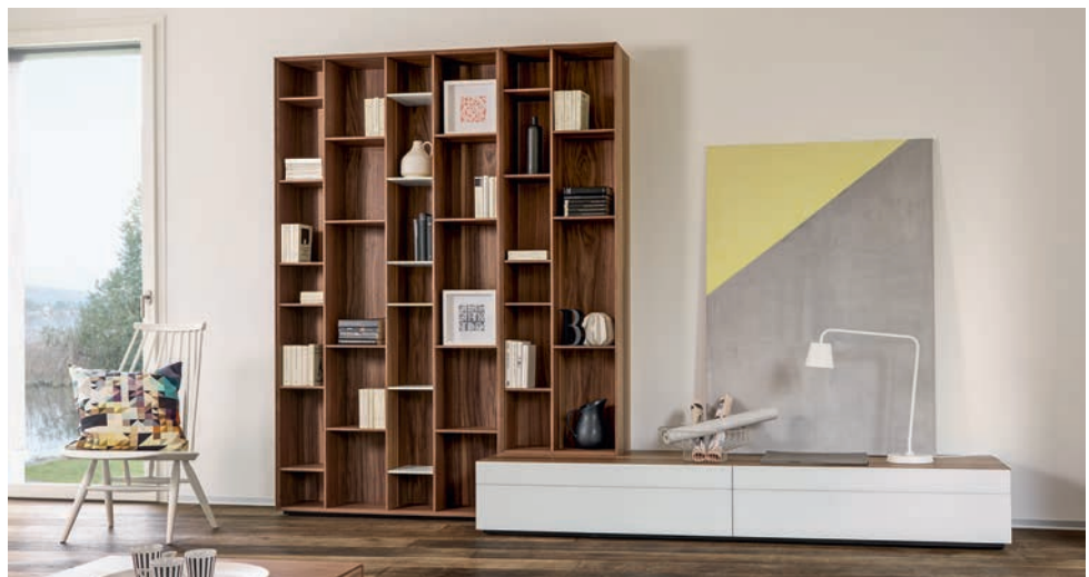
Fraubrunnen: Die bewährte Kollektion Formart erhält mit «s2» einen Relaunch. Neu bietet sie zusätzlich Vitrinen, Regale, Korpusse mit Innen- und Aussenschubladen sowie offene Nischenelemente. www.fraubrunnen.com